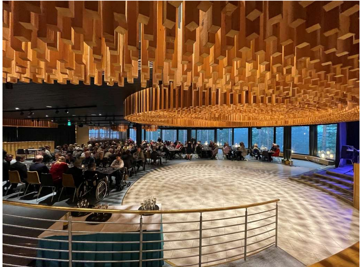
Kuvassa 30.10.2021 yhdistyksen 50v - juhlista tunnelmia

Umpimähkään - Minne memään - mitä tehdään?