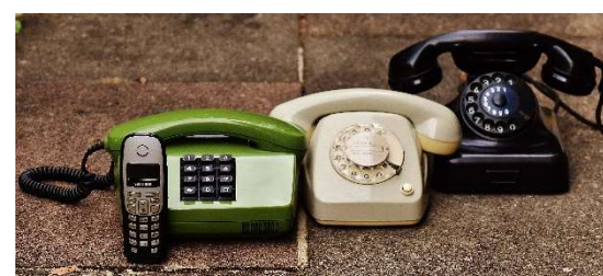
Ota rohkeasti yhteyttä - vaikkakaan ylläolevat välineet eivät enää toimi, niin uudet tavat ovat käytössä!

Jos sinulla on innostusta lähteä yhdistykseen aktiivijäseneksi ja esim. järjestämään tapahtumia, niin olethan rohkeasti yhteydessä! Keksitään yhdessä mitä kaikkea voisimme tehdä.